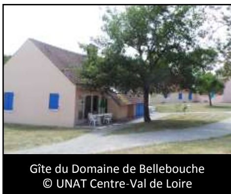
Gîte du Domaine de Bellebouche

L'édition 2016 du dispositif « 1ères vacances » se termine, retour sur les séjours des vacanciers.