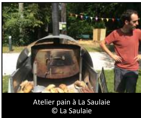
Atelier pain à La Saulaie