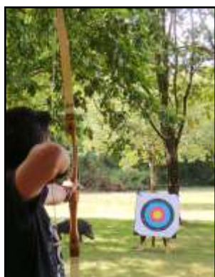
Tir à l'arc à la Ferme de Courcimont