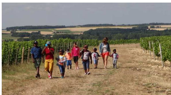
Découverte des vignes du Père Auguste (Civray de Touraine) 9 juillet 2015